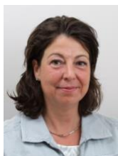
M. de Bruijn Haarverzorging